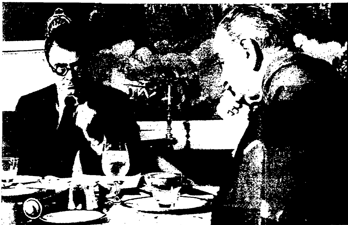
الرئيس جونسون يستمع الى تقرير من المستر سيروس فانس عن سير المعاملات التمهيدية مع الوفد اللبناني الشمالي في باريس . وقد عاد المستر فانس الى باريس امس

بين العراق والخليج بغداد - ا. ب. - ثري حكومة العراق اصدار قانون جعل بموجبه شركة الملاحة البحرية التي تملكها الدولة - الشركة الوحيدة التي لها حق نقل البضائع والركاب بين العراق وامارات الخليج العربي .